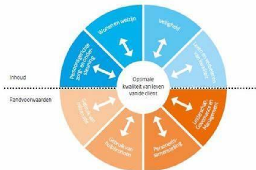
Figuur 1: Integraal model voor dynamisch en ontwikkelingsgericht werken aan kwaliteit verpleeghuiszorg

We sluiten af met de beschrijving hoe we dit proces bewaken, evalueren en zo nodig verbeteren. Met dit stuk maken we een duidelijk handvat waarin beschreven staat hoe de huidige kwaliteit van zorg in ons huis is én de punten waarop wij ons willen verbeteren.